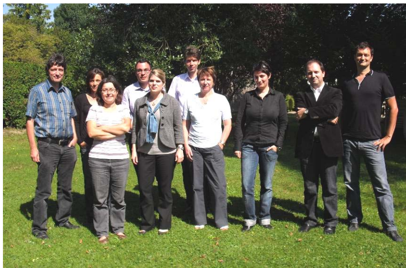
Les participants de la communauté du savoir-faire «Mise en œuvre de la NPR au niveau cantonal» le 8 septembre 2009, à Yverdon-les-Bains.

Le premier nouveau bâtiment pour le Technopôle de Sainte-Croix, photo K. Conradin