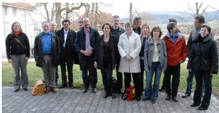
Les participants à la communauté du savoir-faire «Coordination NPR-Politiques sectorielles – économie rurale, tourisme et espace vital» le 19 mars 2009 à Courtemelon (JU).

Spécialités régionales du Jura, photo K. Conradin.