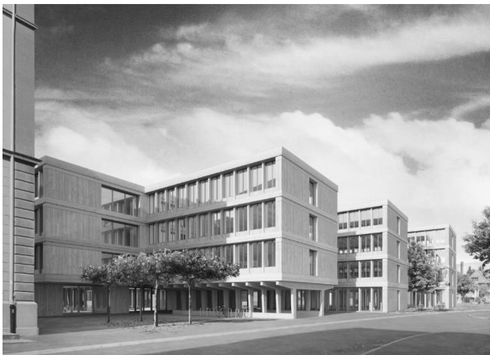
Figure 1: Bâtiments administratifs en Thurgovie

ce qui a permis d'éviter des émissions grises. L'installation de Roche de Mars utilise également du bois indigène du Jura pour la construction de sa centrale de chauffage.