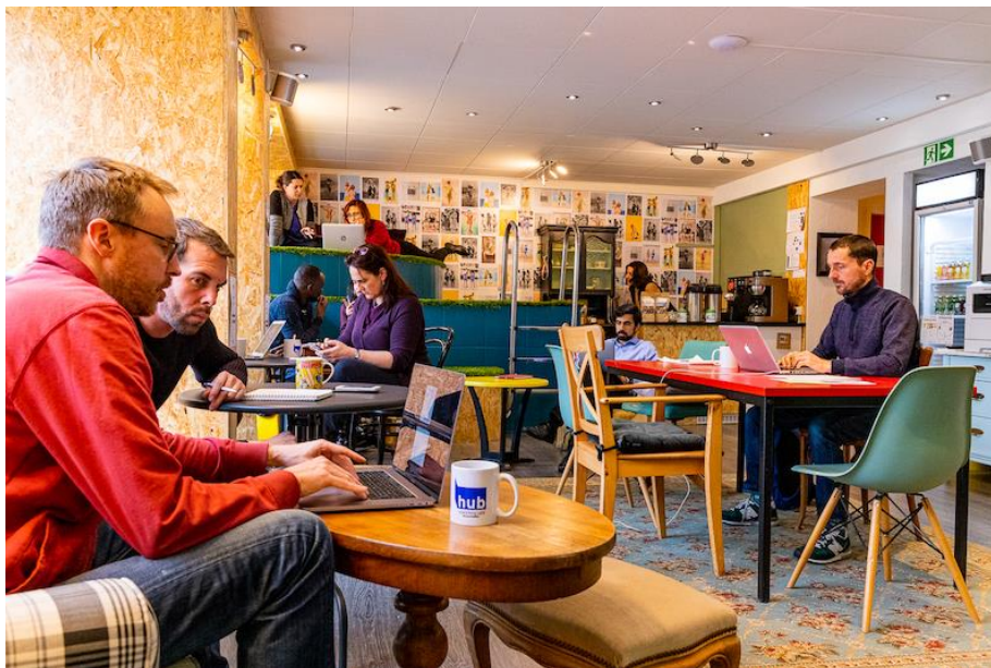
Figure 2: Innovation environnementale et sociétale (hub Neuchâtel)