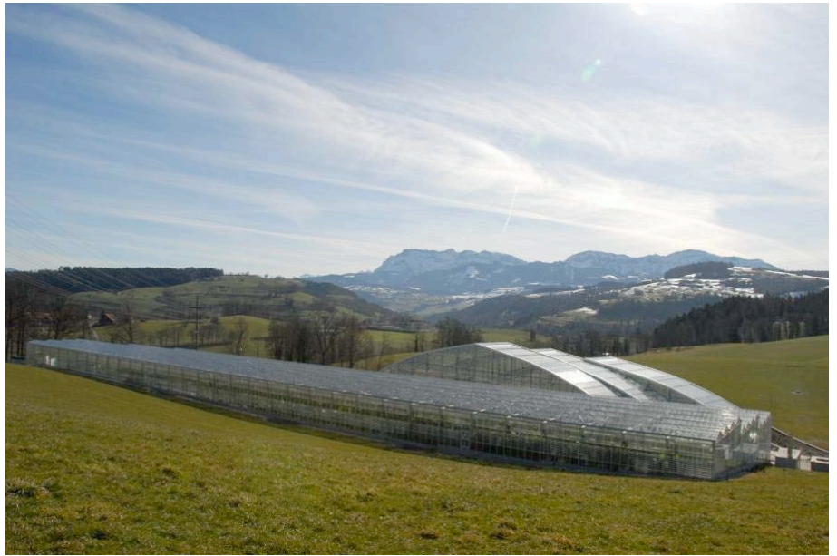
Das Tropenhaus Wolhusen kurz vor seiner Eröffnung im März 2010.