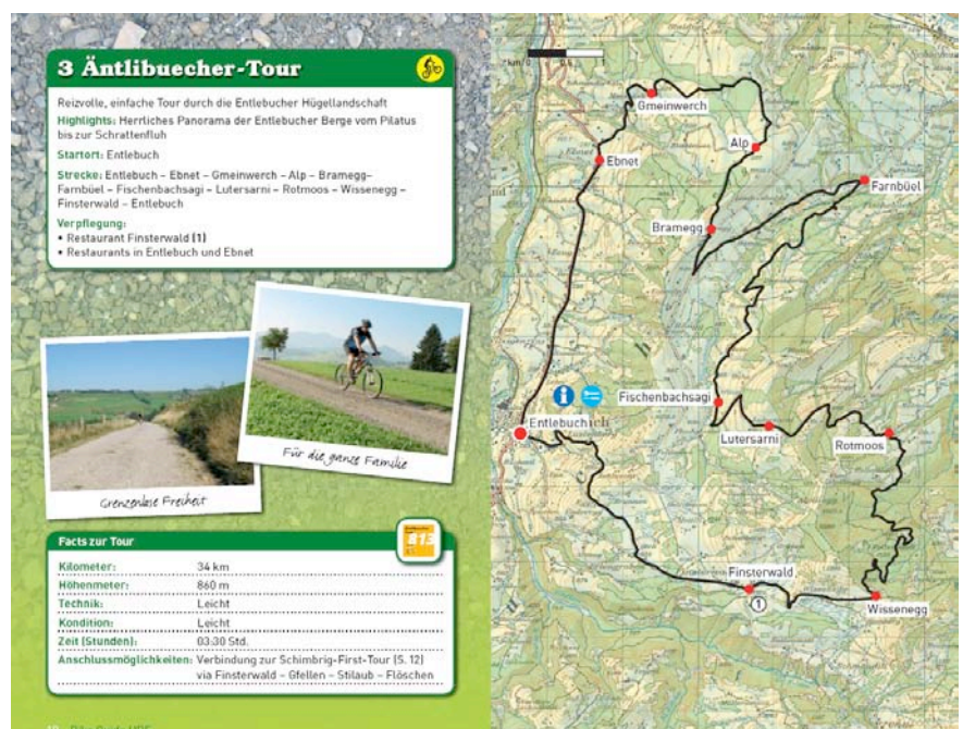
Beispiel einer der erarbeiteten Routen

Die Landbesitzerinnen und -besitzer werden nicht dafür entschädigt, dass die Route auf ihrem Boden verläuft. Dies war seitens der Landbesitzenden nie ein Thema. Wichtig ist, dass die Besucherlenkung zusammen mit den Beteiligten abgesprochen wird. So können z. B. die Landwirtinnen und Landwirte direkt auf die Routenführung Einfluss nehmen und die Kundschaft an ihren Höfen vorbeiführen. Lokal kann die Landwirtschaft auch Produkte oder Dienstleistungen anbieten, um Wertschöpfung zu generieren.