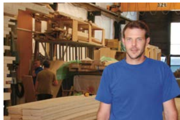
83 Beer Holzbau AG