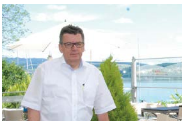
76 Seehotel Hallwill