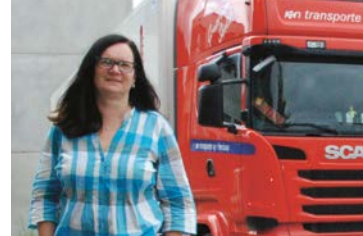
57 r+n transporte AG