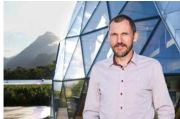
26 Texner SA