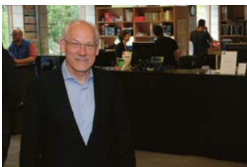
62 Josias Gasser Baumaterialien AG