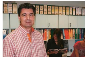
72 CERT ingénierie SA