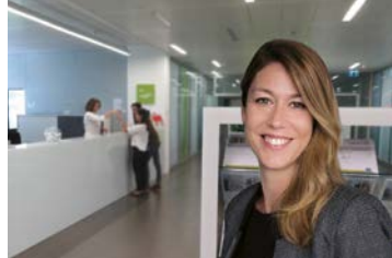
48 Régie du Rhône