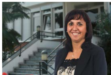
68 Ginsana SA (Gruppo Soho Flordis International)