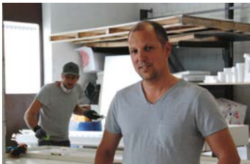
39 Dade-Design AG