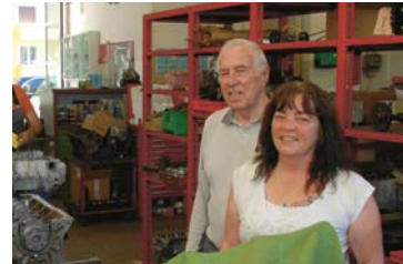
33 Remo AG