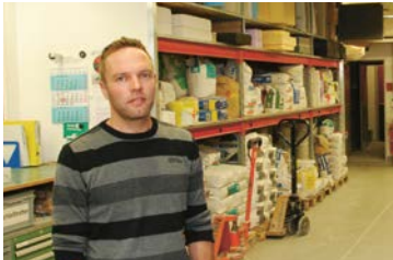
15 Wenger Hess & Partner GmbH