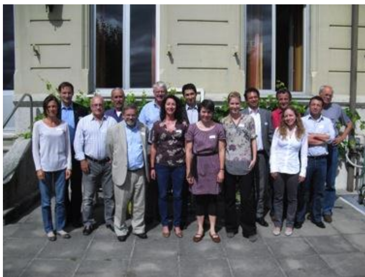
Les participants de la communauté du savoir-faire «Romandie», le 7 septembre 2011, à Neuchâtel.

Viège, dans la vallée du Rhône.