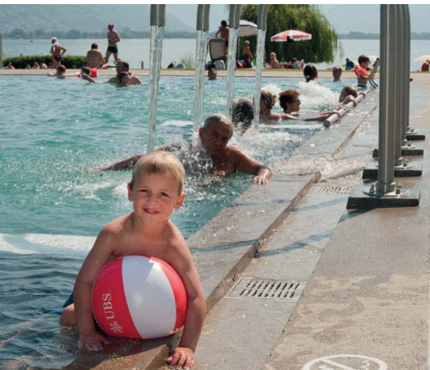
Lido di Locarno