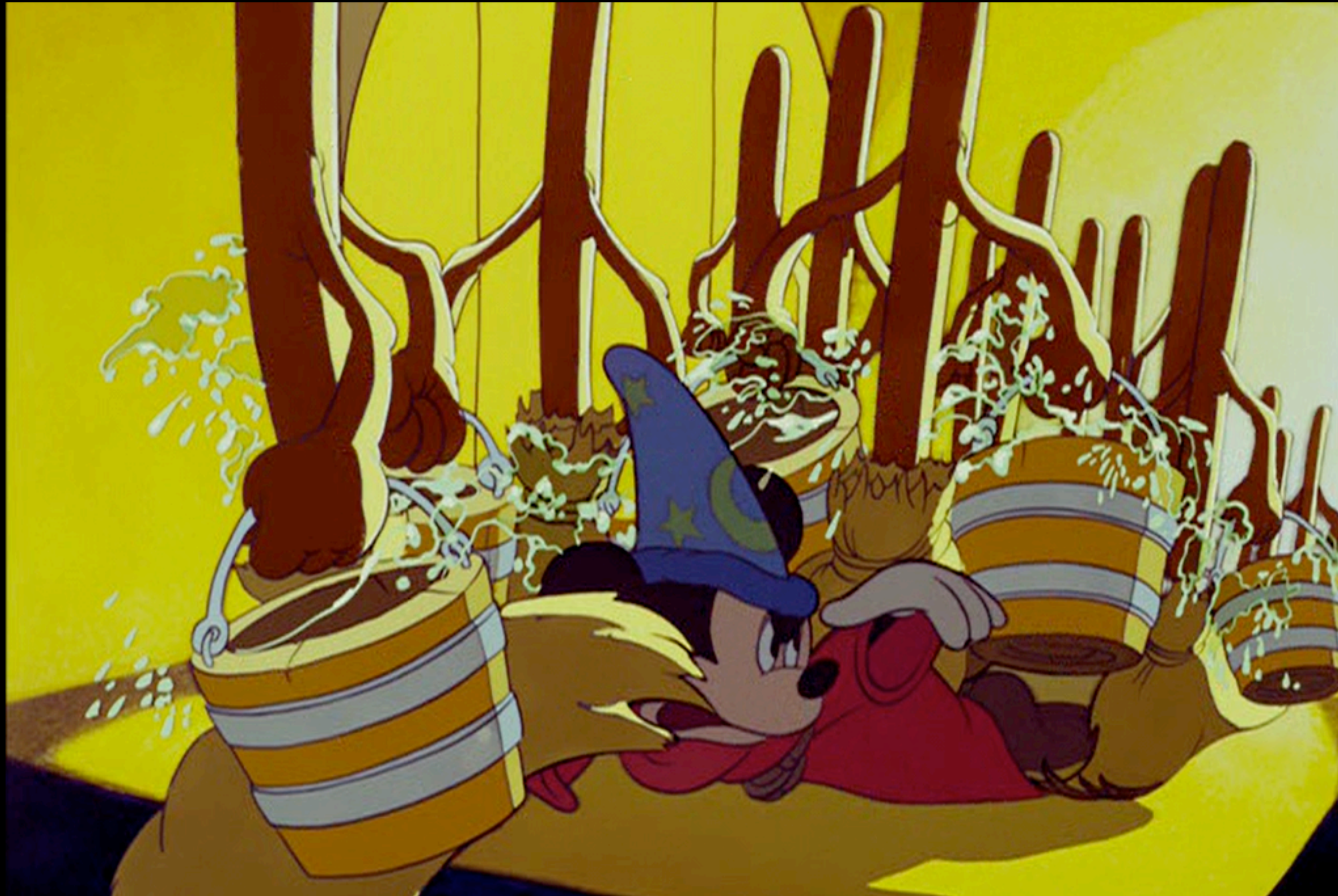
Silicon Valley als Zauberlehrling