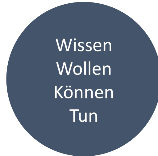
Regionalentwicklung als Handlungsmodell