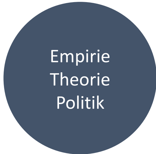
Regionalentwicklung als (Sozial-)Wissenschaft