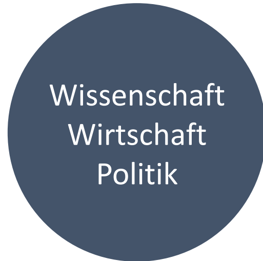
Regionalentwicklung als Dialog